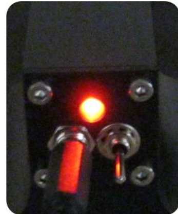
► Açık ve kapalı durumları belirten led gösterge

* Farklı dalga boyu ve güç değerleri için irtibata geçiniz. ** Boyutların haber verilmeden değiştirilme hakkı saklıdır.