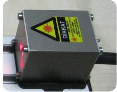
► Çeşitli renk seçenekleri