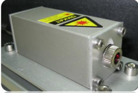
► Paralel hale getirilmiş ışın