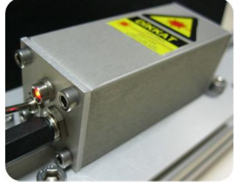
► Pratik kullanıma uygun gövde boyutları